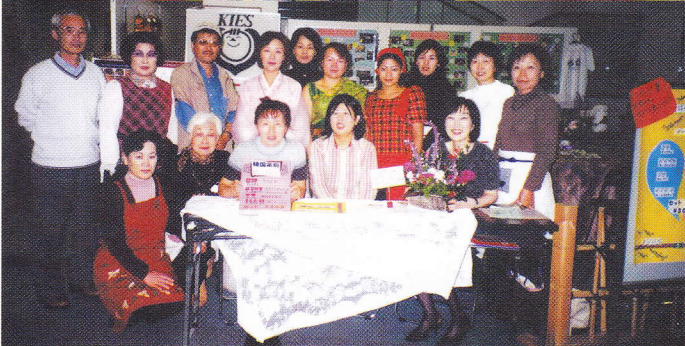
韓国茶房では、とうもろこし茶、カルピタンなど好評でした。