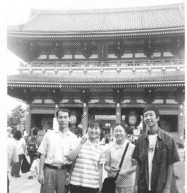
▲ホストファミリーと一緒に▶